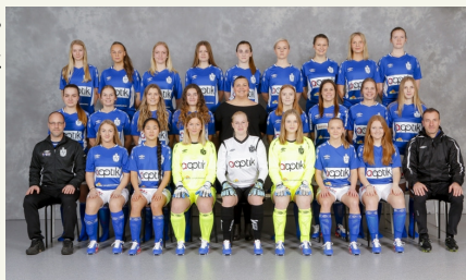
Ljungbydamerna börjar om i trean under 2017.

Det innebär att Ljungbydamerna kommer att spela i division 3 med sitt A-lag och i division 4 med sitt B-lag under fotbolls-säsongen 2017.