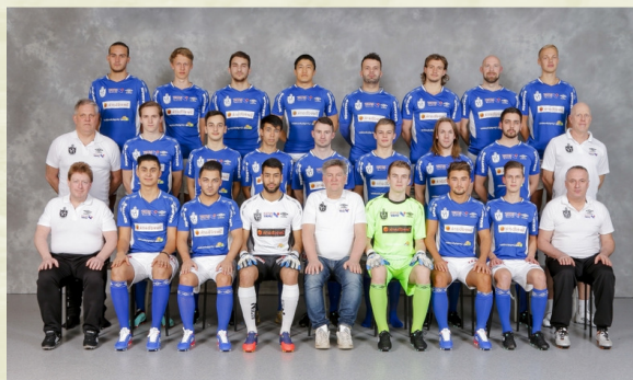
LIF herr 2016.

därtill inga degraderade lag En serie som i ärlighetens från tvåan. namn inte verkar alltför tuff.