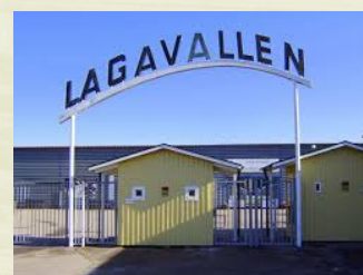
Den sista säsongen på gamla Lagavallen är avverkad.

på moset i årets säsong var väl egentligen herrarnas unga B-lag som vann sin serie.