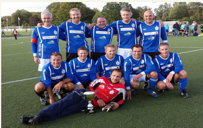
Det blev tronskifte när Sponsorfotbollen spelades den 23 augusti.

Regerande mästarna Electrolux lyckades denna gång inte ta sig vidare till final, utan det blev Konecranes som ställdes mot kombinationslaget LIF Ungdomsledare/Läkarhuset. I en jämn och välspelad final drog slutligen de sistnämnda det längsta strået och vann finalen med siffrorna 2-0. Ljungby IF vill tacka alla medverkande för en väldigt trevlig eftermiddag/kväll.