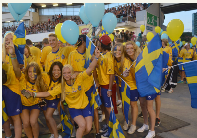
Ljungby IF representerade Sverige under årets invigning av Gothia Cup i Göteborg.

Invigningsshowen på Ullevi inleddes med ett videomeddelande från FIFA:s president Sepp Blatter som bland annat sa att hur mycket han beundrade turneringen och avslutade med att önska alla lycka till. Sedan började den två timmar långa invigningen