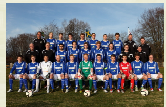
Ljungbys fotbollsherrar har fått en tuff inledning på säsongen 2012.

I herrarnas reservserie kan det samtidigt konstateras av LIF spelat ihop tolv poäng av tolv möjliga, full pott med andra ord.