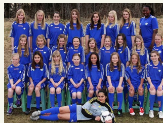
Växjö FF:s flickor segrade i den sjunde upplagan av Dans Minne.

På flicksidan blev Växjö FF 2 slutsegrare, men inte utan att möta rejält motstånd. I finalen fick straffläggning tillgripas för att kunna skilja Växjölaget från sina finalmotståndare, IFK Värnamo vit.